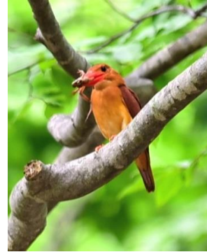
⇒ ブッポウソウ ⇐ アカショウビン