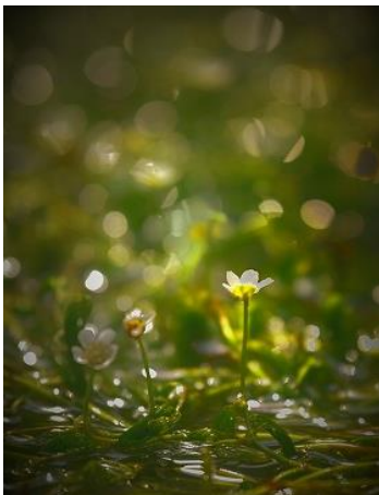
③ 中川 孤独な梅花藻 米原市 醒ヶ井 f/2.8 1/640 200 100

このわいわい写真クラブに入会させて頂き、写真の技術は余り上達しませんが、皆様と知り合いになれ活動できる事、また個人的な事でもいろいろご支援ご指導をいただいた方々に心から感謝しています。何か問題があった時、相手だけに原因があると思っていると不和解消せず、自分を振り返る事が大事だと思っています。「縁」から始まる人生一期一会を大切にすることが私のルールだと思っています。