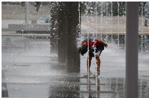
② 中 バッシャーッ! 堺市浜寺公園 f/5.6 1/1600 208 1250