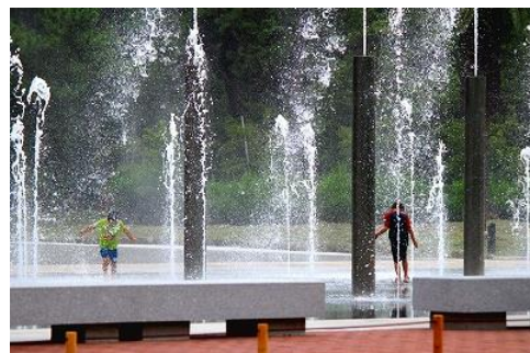
④ 中 噴水たのし 堺市浜寺公園 f/5 1/1250 123 1000