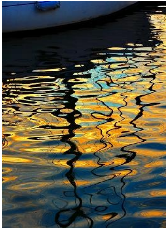
④ 杉本 ヨットハーバー の空 旧堺港 f/8 1/100 102 400