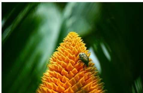
⑥ 中 ソテツの花に恋の使者 大浜公園蘇鉄山 f/5.6 1/250 135 100