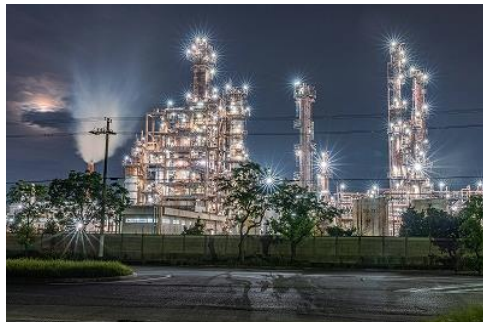
⑤ 藤岡 鉄と光のシンフォニー 堺市築港新町