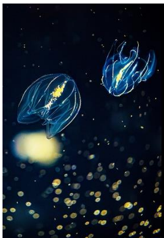
④ ゆらゆら海月 海遊館 f/1.2 1/320 17 6400