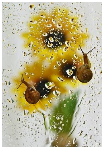
④ 冠木 もうすぐ 梅雨明け 自宅 堺市鳳南 f/13 1/10 90 320