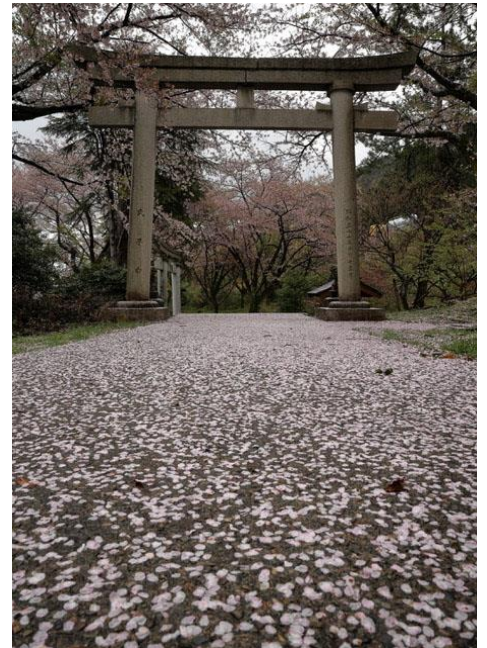
富山県下新川郡・境神社

孤独感を味わいながら行ったことのない場所や、見たことのない風景をカメラに収めるのが楽しいのです。どちらかと言うと写真より旅の方に重点をおいているのかもしれませんが、撮影スポットを巡っていい写真を撮るとい目標がないと旅そのものが空虚なものとなってつまらなくなる様な気がするのです。それなら、夫婦で温泉旅行に出掛けたついでに写真を撮れば良いのに、という人もおりますがそれは無理なのです。特に風景写真などのシャッターチャンスは太陽が傾いている朝夕に集中するからです。温泉に浸かって、さあ一杯飲んで美味しものを食べようかという時刻と重なるからです。ただ、撮影スポット巡りでは見た事のある同じ様な写真になりが