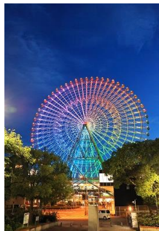
⑤ 鷹巢 光の中へ 天保山 f/6.3 1/40 29 12800