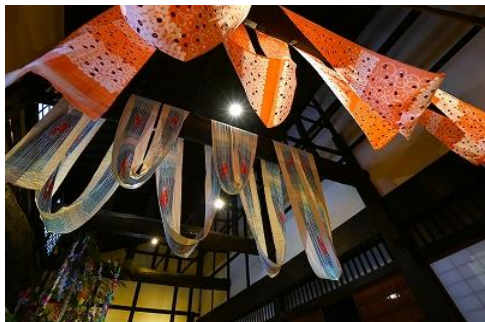
④ 中谷 織姫の忘れ物 堺市山口家住宅