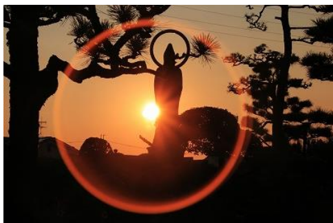
④ 譲原 法雲寺の夕景 堺市法雲寺 f/20 1/640 61 1600