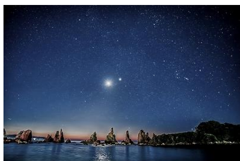
⑥ 夜明け60分前 和歌山県橋杭岩 f/3.5 10 18 5000