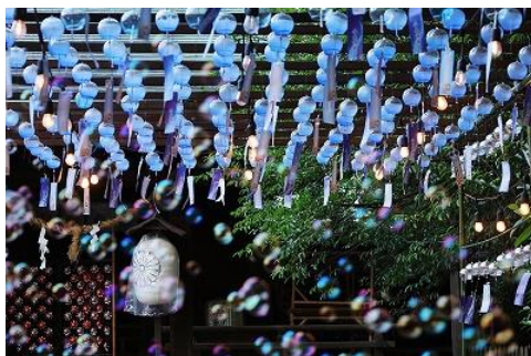
③ 風鈴の下、シャボン玉が描く風景 大阪府水無瀬神宮 f/7.1 1/200 82 6400