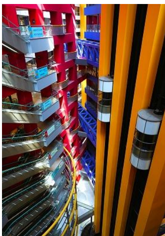
④ 中谷 エレベーター ホール 大阪市ATC f/5.6 1/50 24 400