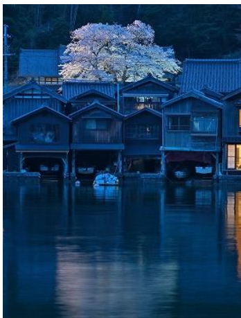
② 冠木 春 舟屋の里 京都府伊根町 f/9 1/1 20 800