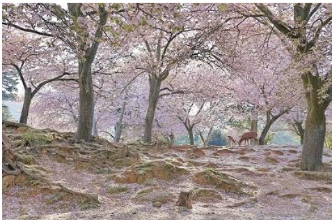
④ 水谷 春の丘