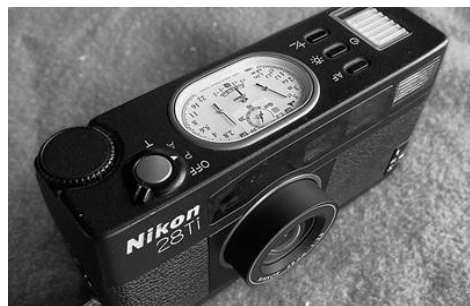
ニコン28Tiコンパクトカメラ

昔、勤務先が肥後橋にあった時、気に入ってた建物があった。大同生命肥後橋ビル、石造りの風格のある建物だった。ある日、前を通ると、ビルのあった場所は更地になっていた。街の風景の変化のスピードを認識した瞬間だった。それから街の風景を意識するようになった。その時、街撮りで使っていたのがニコンの28Ti。28ミリ単焦点を積んだコンパクトカメラ。絞り値や露出補正値などの情報を軍艦部のアナログメーターで表示するというギミック付きで、意味もなくダイヤルを回していた。