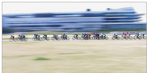
① 岩室 横列 堺市海とのふれあい広場 f/22 1/8 24 50