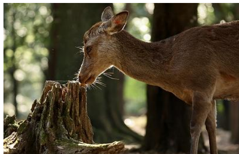
① 杉本 神の使い