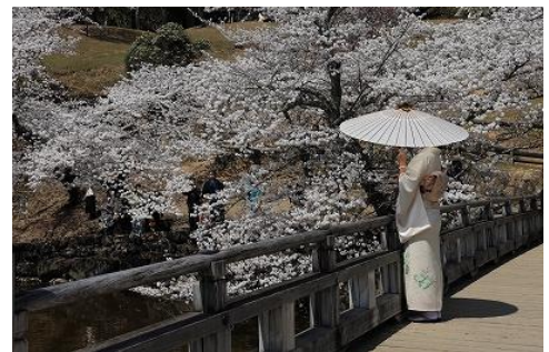
⑤ 中西 春の装い