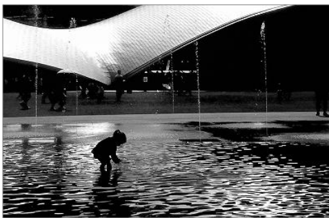
⑤ 中川 水遊び グラングリーン大阪 f/4 1/2000 4.3 100