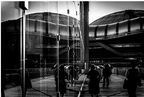
① 古賀 ツインドーム？ f/8 1/320 35 100