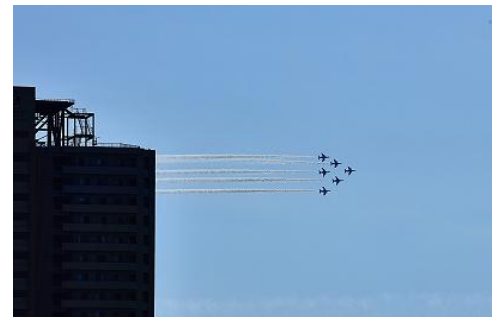
④ 鷹巣 大正ブルー f/11 1/1000 400 400