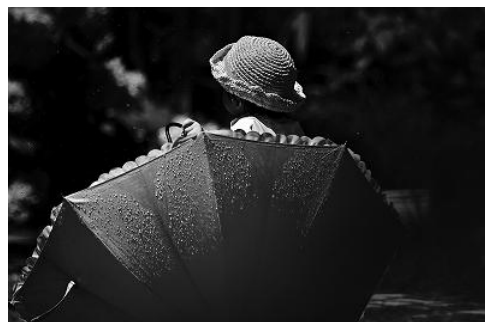
④ 傘の中 堺市緑化センター f/5.6 1/2500 500 250

※ポジショニングマップとは、縦軸と横軸で構成されたグラフ上に写真作品の表現要素を4つの象限に分類して、撮影の目的等を効率的に見つけるツール