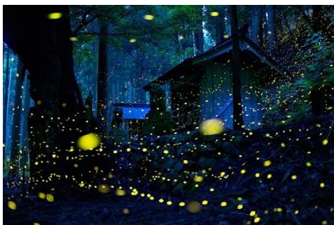
④ 冠木 夜叉の杜(もり) 京都府綾部市 f/1.6 2 35 3200