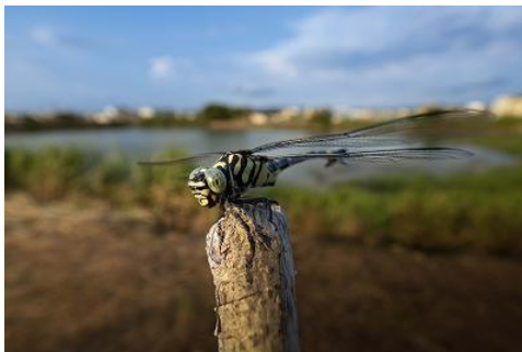
② 辻 一休み 堺市日置荘北町 f/4 1/640 10 160