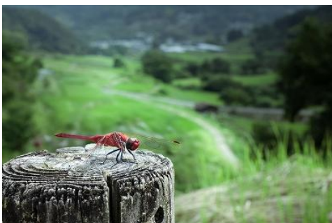
② 辻 一休み 稲渚案山子ロード奥 f/11 1/200 39 400