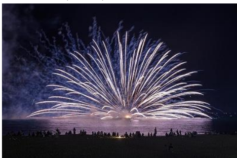
⑤ 水中花火 和歌山県白良浜 f/5 1.8 24 100