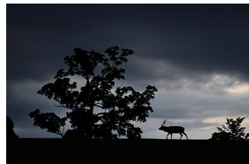
③ 雷雲接近! 奈良公園 f/5.6 1/500 79 6400