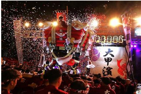
② 岩室 小屋入り 堺市開口神社 f/3.5 1/60 18 800