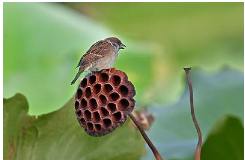
④ 冠木 夏去りて 堺市白鷺公園 f/8 1/800 600 400