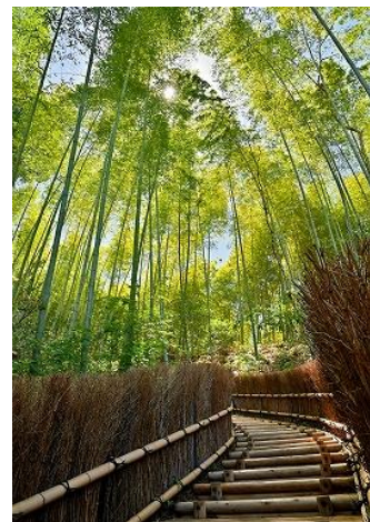
⑤ 冠木 竹林の径 酒船石 f/14 1/80 16 400