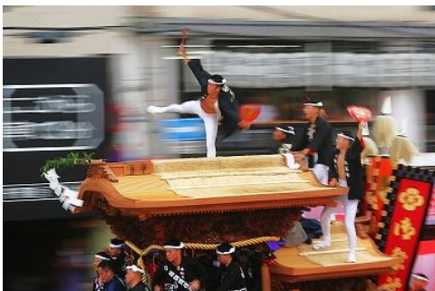
① 岩室 大工方の妙技 岸和田市カンカン場 f/32 1/13 70 200